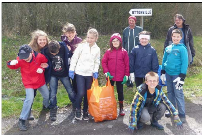
Le groupe de la forêt (ci - dessus) l'œuf, les déchets ramassés et le goûter