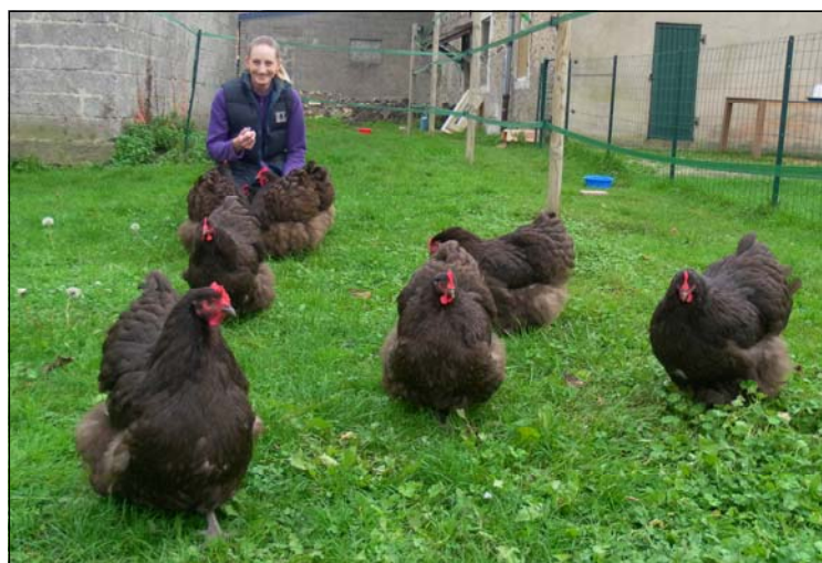
Les Orpington au grand complet

Les Echos d'Ottonville - Ricrange n° 21- juin - octobre 2014