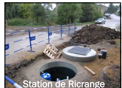
Station de Ricrange