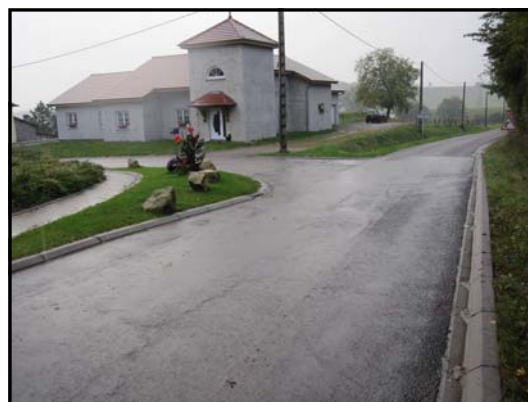
Carrefour rue de la Chapelle

La configuration de ce carrefour ne permet pas une visibilité suffisante et cette situation a déjà généré de nombreuses frayeurs pour la majorité des conducteurs empruntant cet itinéraire. Le nouveau plan de circulation permettra, outre le fait de supprimer une priorité à droite, d'aborder la route de Boulay par la rue de la Chapelle avec une visibilité suffisante pour anticiper la majorité des situations accidentogènes. Toutefois n'oublions pas que la sécurité de tous dépend de la modération de chacun et que seule la prudence permettra de vivre en bonne harmonie avec les véhicules qui traversent de plus en plus nombreux notre commune.