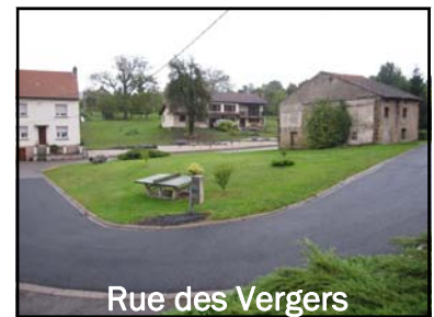
Rue des Vergers