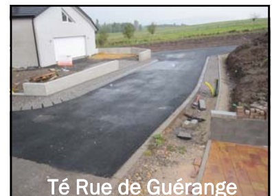
Té Rue de Guérange