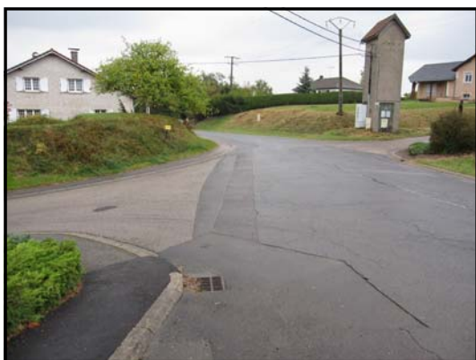
Carrefour rue de la Croix

A compter du 15 Octobre la circulation sera modifiée rue de la Croix à Ricrange. La circulation se fera désormais à sens unique de la route de Boulay vers la rue Sainte Marie et sera interdite dans le sens montant. Pour quitter le village les véhicules emprunteront la rue Sainte Marie et la rue de la Chapelle. Cette modification permettra de réduire le risque que représente la priorité à droite pour les usagers venant d'Ottonville au croisement de la route de Boulay avec la rue de la Croix.