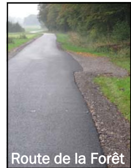
Route de la Forêt